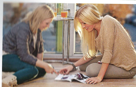
Richtiger Innenausbau – Lebensqualität inklusive