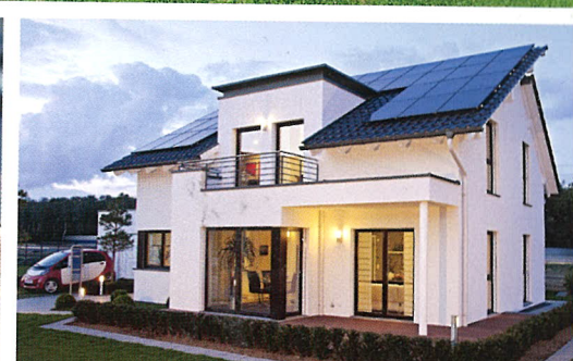
Stromrechnung: nein danke! Energiewende zu Hause