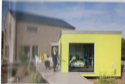
Der große Überblick – von modern bis klassisch